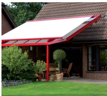
PERGOLY A ZIMNÍ ZAHRADY