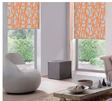
VNITŘNÍ LÁTKOVÉ STÍNĚNÍ