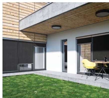
SVISLÉ FASÁDNÍ CLONY