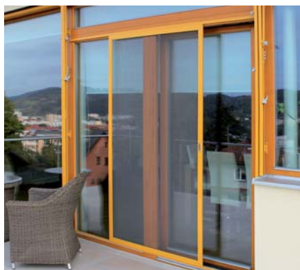
SÍŤ PROTI HMYZU